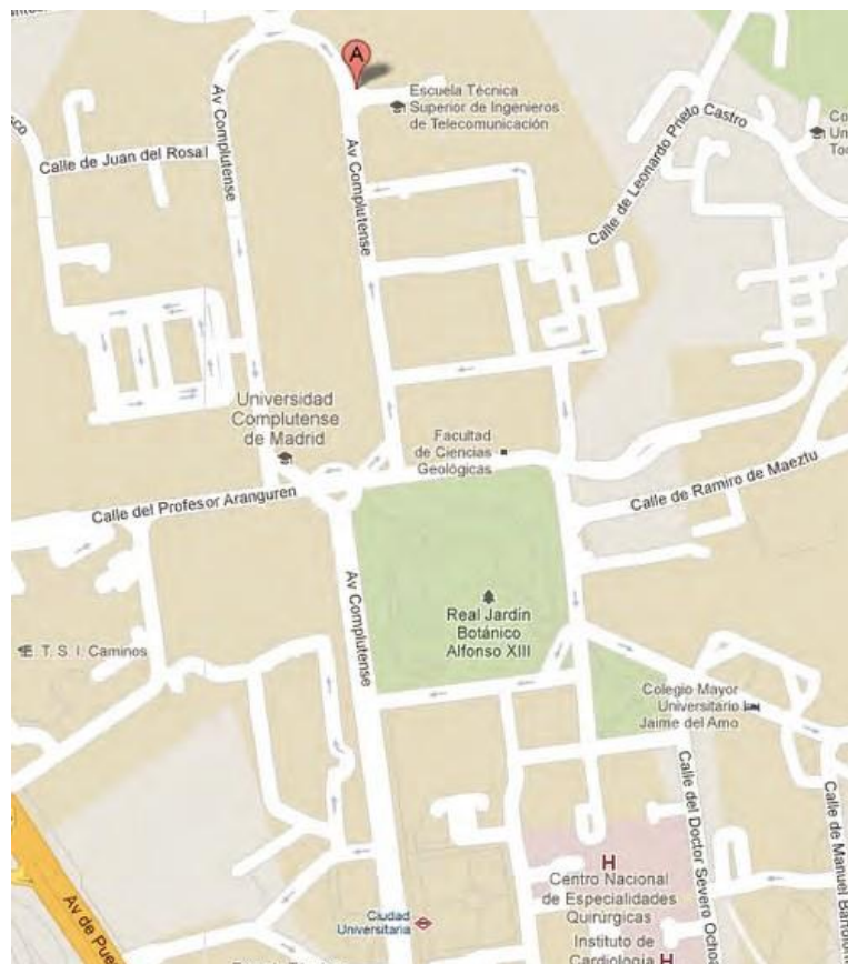
Mapa del Campus. ETSIT UPM (A)